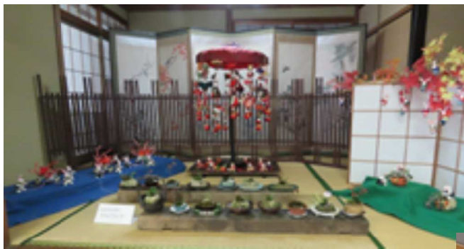
手づくり作品展示

東城まちなみ散歩ギャラリーが令和5年11月3日(金)~11月6日(月)までの4日間行われ、その期間恒例の上町茶屋を開店し、うどん・ぜんざい・いなりの販売・手作り作品の展示を行い賑わいを作りました。イベント開催中、伝統行事「お通り」があり、大勢のご来場大変ありがとうございました。