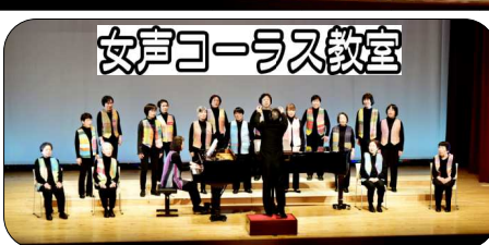
女声コーラス教室