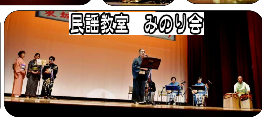
民謡教室 みのり会