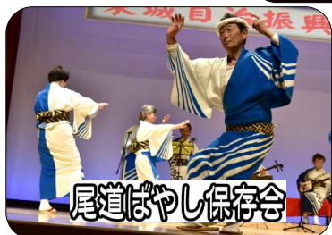
尾道ばやし保存会