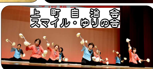
上町自治会 スマイル・ゆりの会