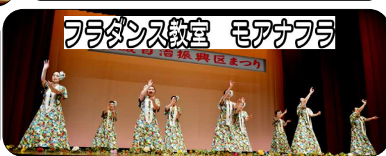
フラダンス教室 モアナフラ