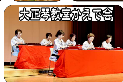
大正琴教室かえで会