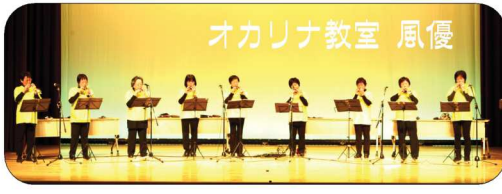
オカリナ教室 風優