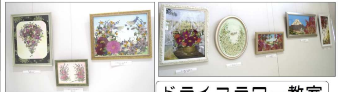
ドライフラワー教室