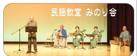
民謡教室 みのり会