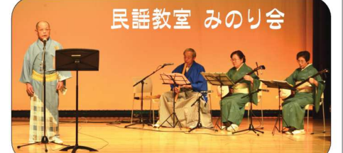
民謡教室 みのり会