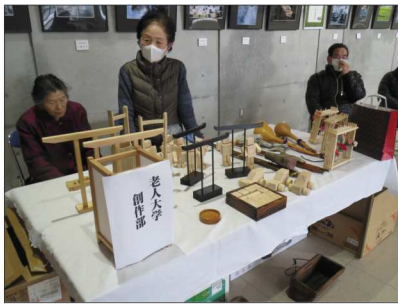
東城老人大学創作部