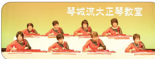
琴城流大正琴教室