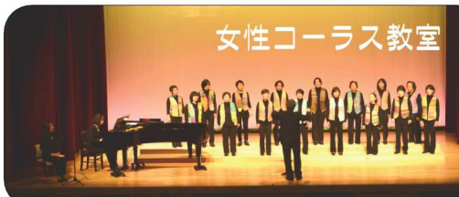
女性コーラス教室