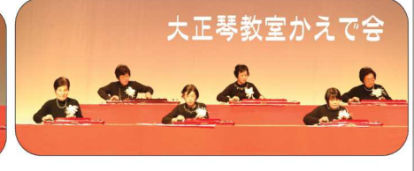
大正琴教室 かえで会