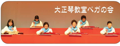
大正琴教室 べがの会