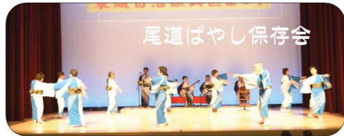
尾道ばやし保存会