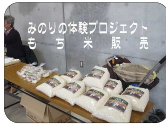
みのりの体験プロジェクト もち米販売