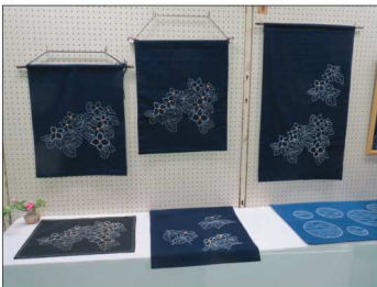
ウーマンカレッジ