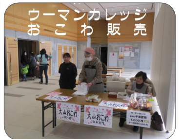
ウーマンカレッジ おこわ販売