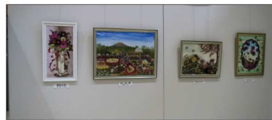
ドライフラワー教室