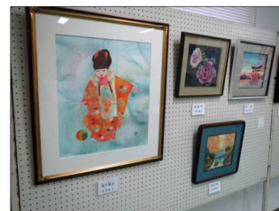
和紙ちぎり絵教室