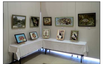
フラワーアレンジ教室