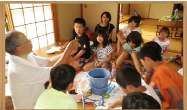
川に住む生き物について勉強しました