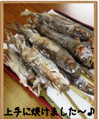
上手に焼きました〜♪