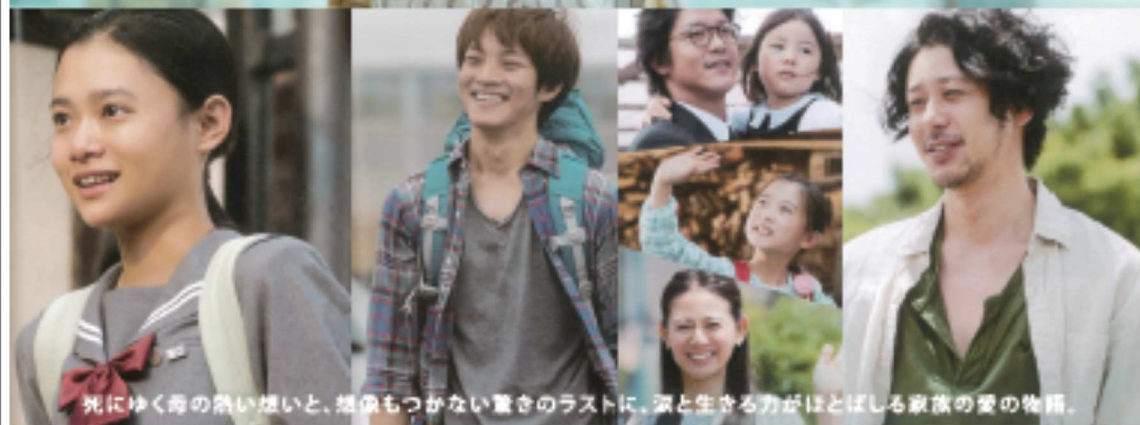
死にゆく母の熱い想いと、想像もつかない重さのラストに、涙と生きる力がほとばしる家族の愛の物語。