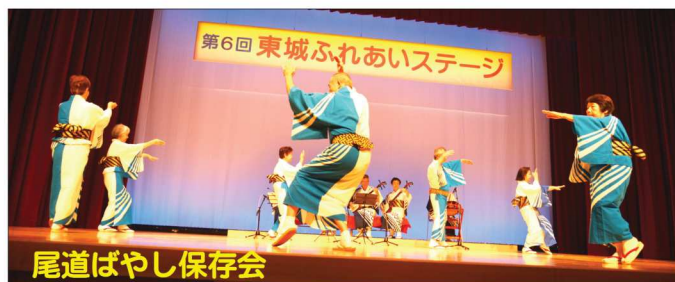
尾道ばやし保存会

10月13日(土)、第6回東城ふれあいステージが開催され、13の団体が積み重ねた練習の成果をステージで発表しました。