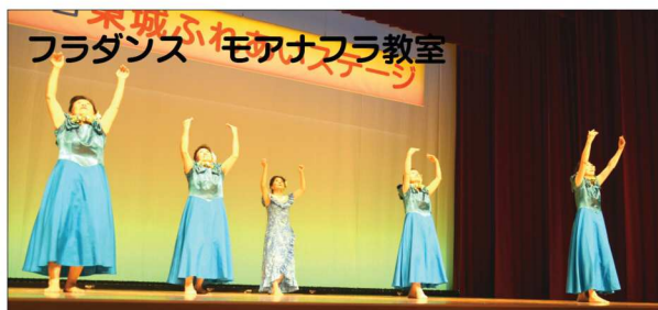
フラダンス モアナフラ教室