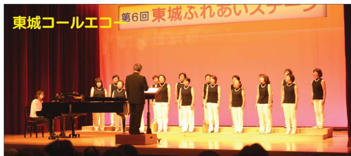
東城コールエコー