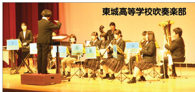
東城高等学校吹奏楽部