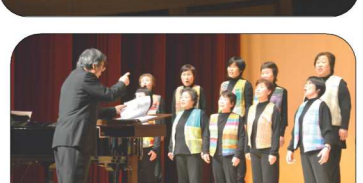
女声コーラス教室