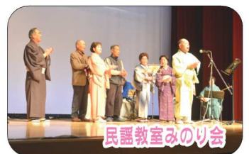
民謡教室みのり会