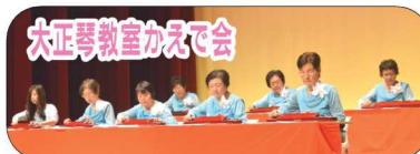
大正琴教室かえで会