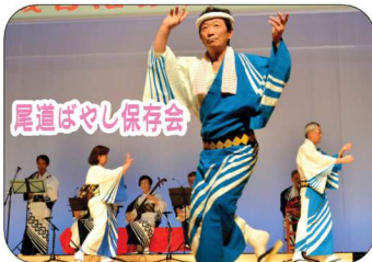
尾道ばやし保存会