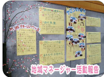
地域マネージャー活動報告