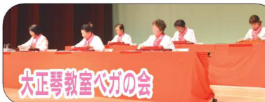
大正琴教室べがの会