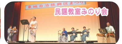
民謡教室みのり会