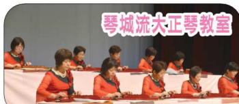
琴城流大正琴教室