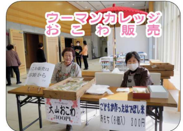
ウーマンカレッジ おこわ販売